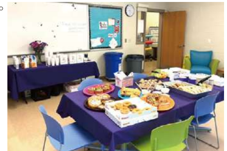
↑アメリカ Teachers application week (教員に感謝を伝える1週間。たくさんのオヤツが用意され、職員はオヤツを食べながら生徒について意見を交わっていた。)

最後にこの場を提供して頂いたことに深く感謝し、2ヶ月という長期間にわたり出張に送り出してくださいましたリハビリテーション部、訪問看護ステーションめぐみをはじめ、全ての職員の皆様に感謝申し上げます。ありがとうございました。