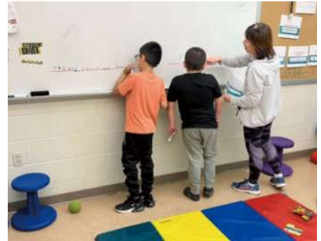
↑アメリカ 学校でのOTの様子

私はリハビリテーション部に所属し、様々なお子様やそのご家族様の支援に携わせて頂いています。その中で、お子様が所属する場所や関わる支援者は数多く、他施設や他職種との連携や計画立案をどうすればよりそのお子様やご家族様らしい支援計画になるのか、何か必要な仕組みがあるのだろうかと考えることがありました。そんな時、海外ではOTやPTといったセラピストが学校などのお子様が実際に生活している場所に勤務していると知り、その実際の様子を見てみたいと、この研修にチャレンジさせて頂くこととなりました。